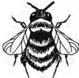
Borinot del gènere Bombus .

En primer lloc ens hem de treure del cap que les bestioles són una amenaça per a les nostres plantes. Per molt que tinguin un aspecte estrany, la majoria són inofensives, algunes són extraordinàriament beneficioses i d'altres són del tot imprescindibles.