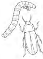
Cuca de llum